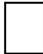
Huella Digital (índice derecho)